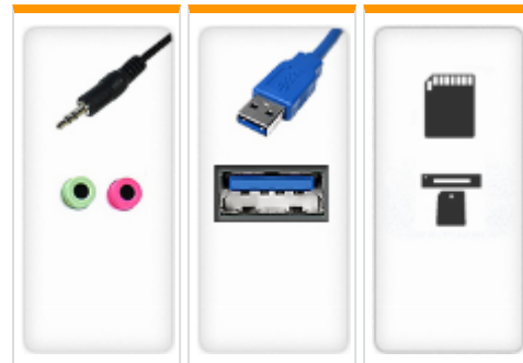
Audio In/Out 1x USB-A 3.0 2x Cardreader * 2x