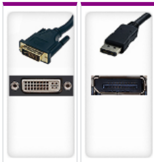
DVI-I 1x Display Port 1x